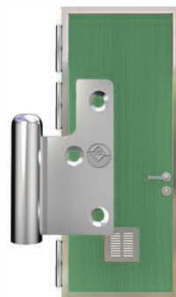
Крючки изготовлены из нержавеющей стали