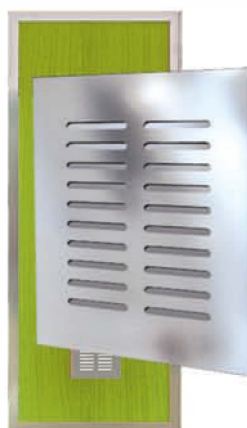
Решетка сделана из нержавеющей стали