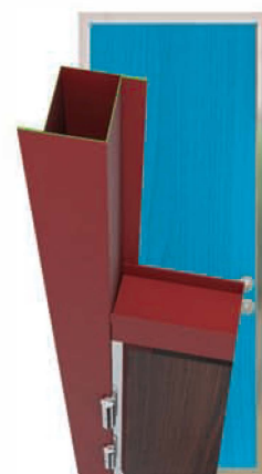
Дверная рама сделана из коробчатого профиля, рама покрыта порошковой краской