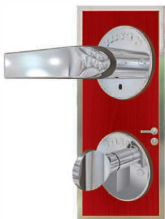
Дверные ручки полностью выполнены из нержавеющей стали