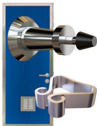
Фиксаторы дверей изготовлены из нержавеющей стали