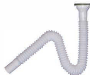
Водозаборная труба изготовлена из пластика