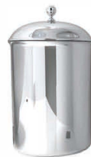
Мусорная корзина с крышкой крепится к стене Корзина изготовлена из нержавеющей стали