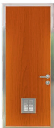
Поверхность дверного листа – ПВХ