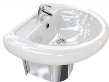
Керамическая раковина с подставкой изготовлена из нержавеющей стали