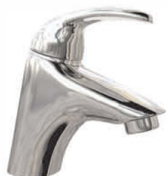
Смеситель для раковины изготовлен из хромированной меди