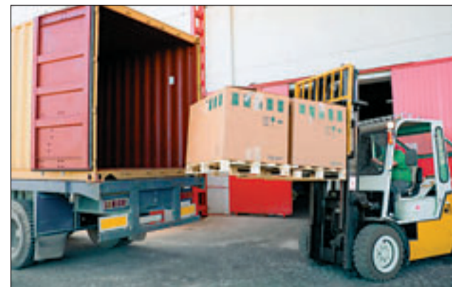
УСЛУГИ КОМПАНИИ «КАНОНЕРСКИЙ»:

для оказания качественных, оперативных и доступных по стоимости услуг.